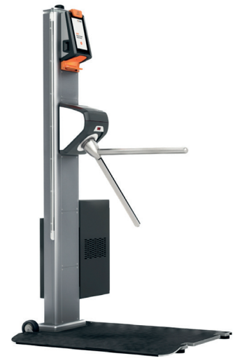
AX500 Smart Gate NG NFC AKKU Mobile Palette